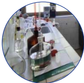
KVALITET VODE ZA PIĆE